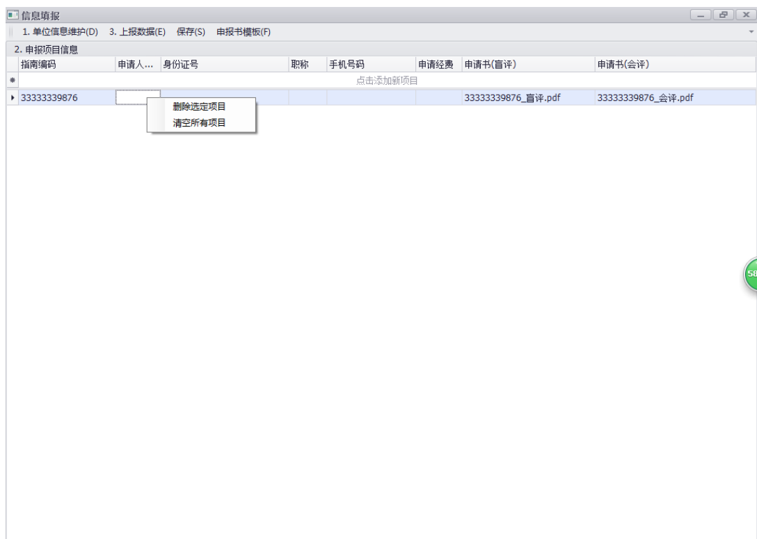
图 3 删除项目信息